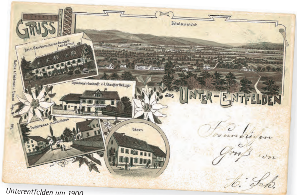
Unterentfelden um 1900