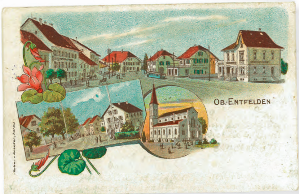
Oberentfelden um 1902