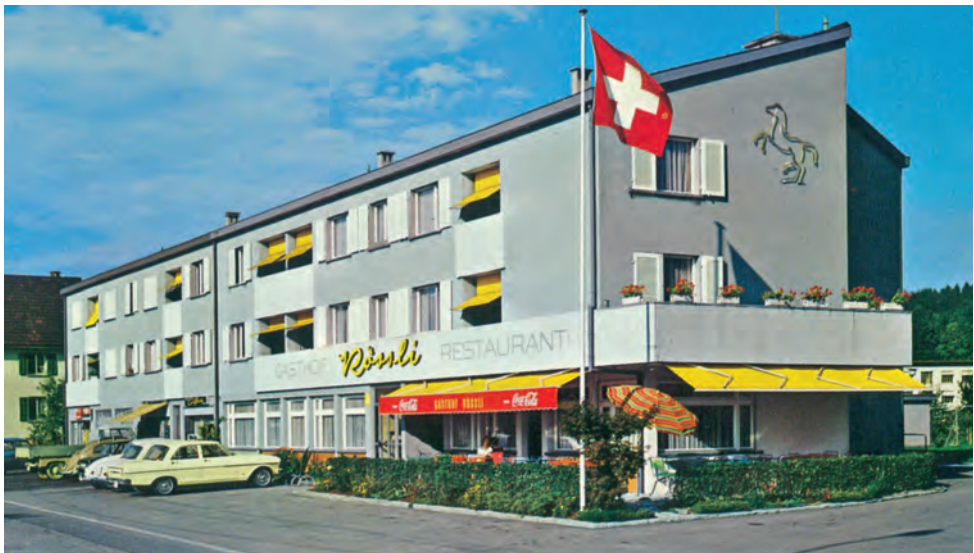
Auch das «Rössli» erlebte blühende Zeiten.

Der Kantonale Sozialdienst (KSD) hat das dem Bären angegliederte Hotel T8 für Geflüchtete angemietet. Diese Unterkunft bietet mit ihren 40 Studios Platz für maximal 150 Personen, schreibt der Kanton. Bereits Mitte Oktober wurde die Unterkunft in Betrieb genommen. Die Belegung wird etappenweise stattfinden und ist abhängig von der Entwicklung der Zuweisungen von geflüchteten Personen durch den Bund. Zudem wird es eine Rund-um-die-Uhr-Betreuung geben. Diese wird gemäss Angaben des Kantons durch die ORS Service AG übernommen. Über eine Hotline könne die Unterkunft jederzeit kontaktiert werden. Der Kantonale Sozialdienst setzt für die Dauer des Betriebes eine Begleitgruppe ein, um allfällige Probleme zu lösen. Diese Begleitgruppe bestehe aus Vertretern der Gemeinde Unterentfelden, des KSD, der ORS Service AG sowie aus Anwohnerinnen und