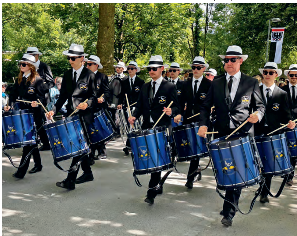
Entfelder Tambouren am Aarauer Maienzug