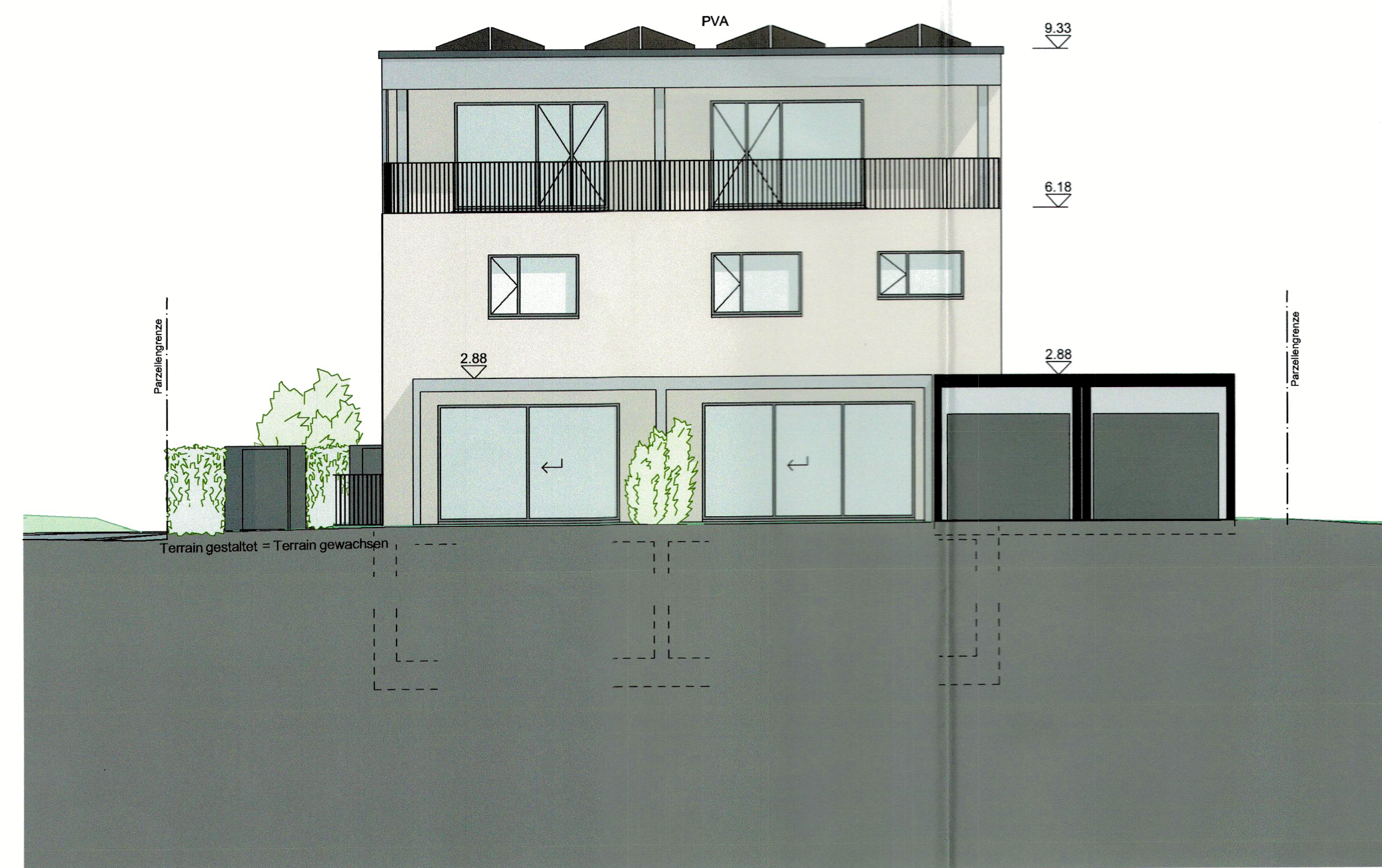
A/01 Ansicht Süd 1:100