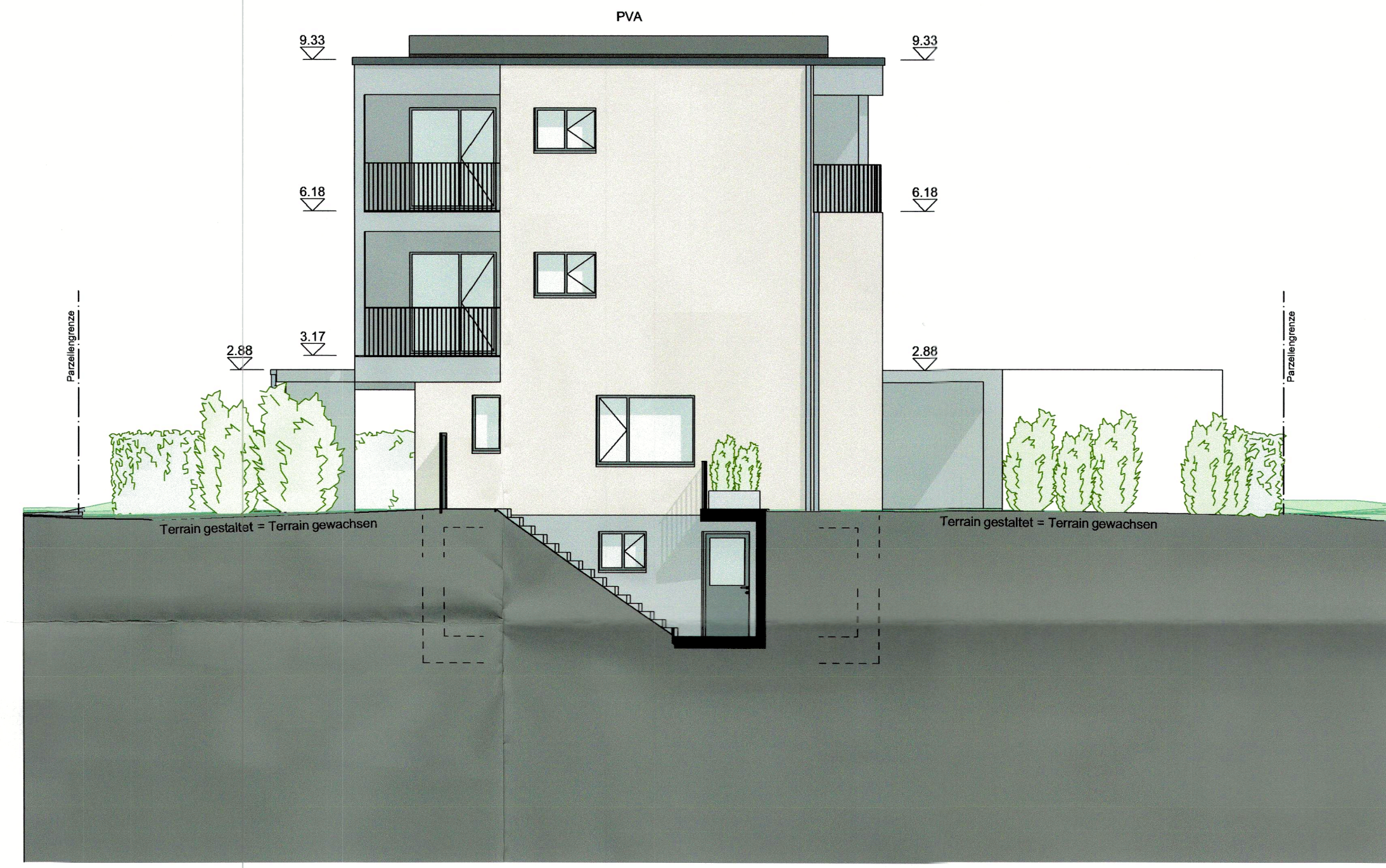
A/03 Ansicht West 1:100